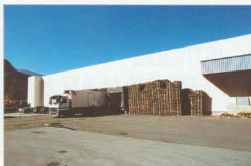
Zone de chargement