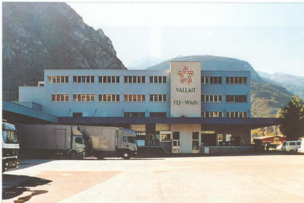
Vue Nord côté entrée principale

Groupe Fédération Laitière Valaisanne et ses filiales Vallait SA et Valcrème SA