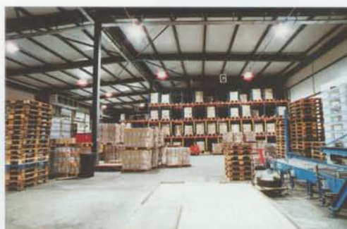
Halle de stockage de 21'000 m3