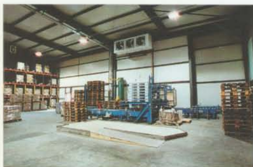
Machine pour charger les palettes